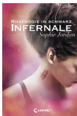
Infernale (Band 2) - Rhapsodie in Schwarz