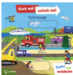
Guck mal, schieb mal! Suche und entdecke - Fahrzeuge