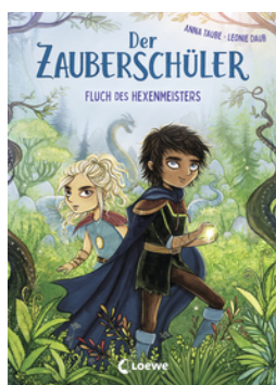
Der Zauberschüler (Band 1) - Fluch des Hexenmeisters