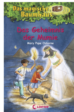
Das magische Baumhaus (Band 3) - Das Geheimnis der Mumie