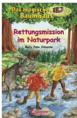
Das magische Baumhaus (Band 59) - Rettungsmission im Naturpark