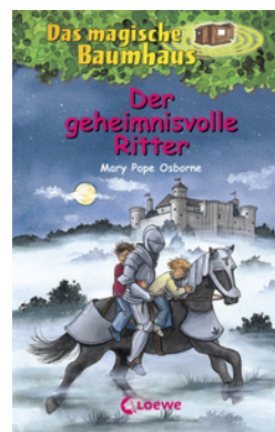
Das magische Baumhaus (Band 2) - Der geheimnisvolle Ritter