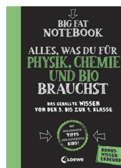
Big Fat Notebook - Alles, was du für Physik, Chemie und Bio brauchst - Das geballte Wissen von der 5. bis zur 9. Klasse. Mit Bonuswissen: Erdkunde