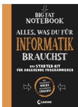
Big Fat Notebook - Alles, was du für Informatik brauchst - Das Starterkit für angehende Programmierer