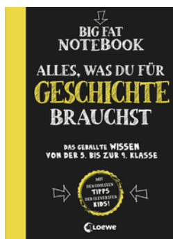
Big Fat Notebook - Alles, was du für Geschichte brauchst