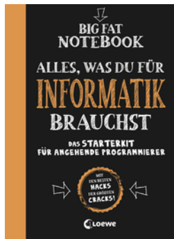
Big Fat Notebook - Alles, was du für Informatik brauchst - Das Starterkit für angehende Programmierer