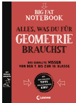
Big Fat Notebook - Alles, was du für Geometrie brauchst