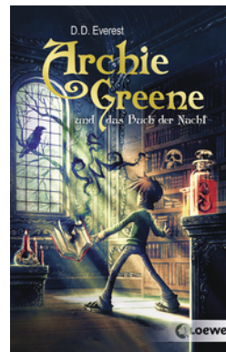
Archie Greene und das Buch der Nacht (Band 3)