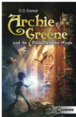
Archie Greene und die Bibliothek der Magie (Band 1)