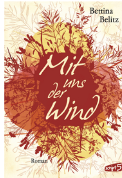
Mit uns der Wind