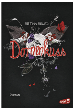
Splitterherz – Dornenkuss