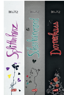
Splitterherz, Scherbenmond, Dornenkuss – Die komplette Trilogie