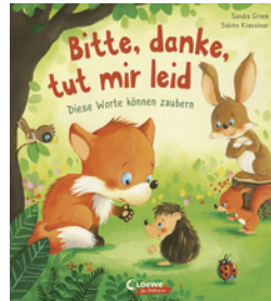
Bitte, danke, tut mir leid