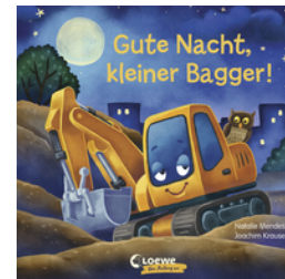
Gute Nacht, kleiner Bagger!