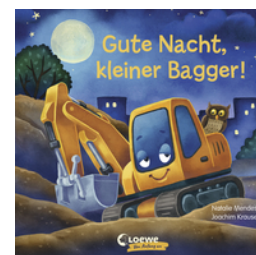
Gute Nacht, kleiner Bagger!