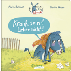
Der kleine Esel Liebernicht - Krank sein? Lieber nicht!