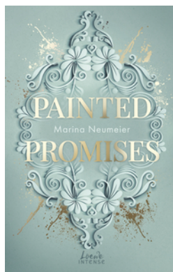
Painted Promises (Golden Hearts, Band 3)