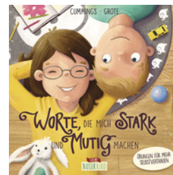
Worte, die mich stark und mutig machen