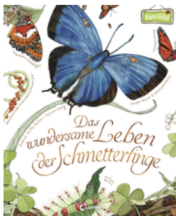
Das wundersame Leben der Schmetterlinge