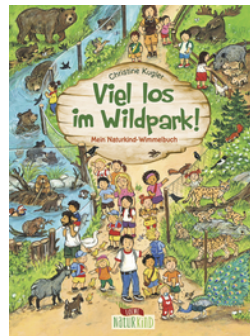
Viel los im Wildpark!