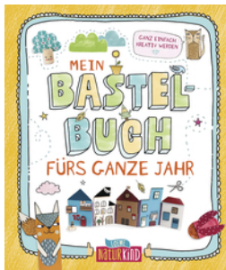
Mein Bastelbuch fürs ganze Jahr