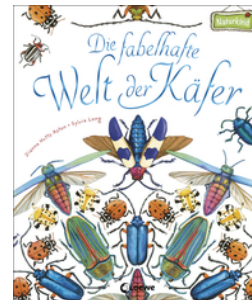
Die fabelhafte Welt der Käfer