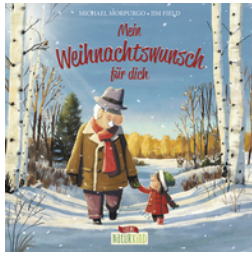
Mein Weihnachtswunsch für dich