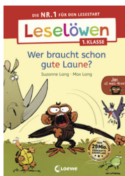
Leselöwen 1. Klasse - Jim ist mies drauf - Wer braucht schon gute Laune?