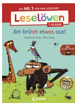
Leselöwen 1. Klasse - Jim ist mies drauf - Jim brütet etwas aus!