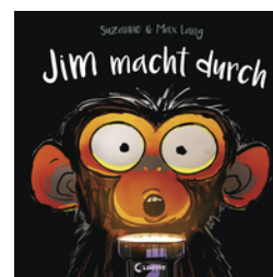
Jim macht durch