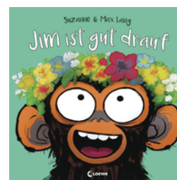
Jim ist gut drauf