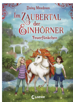
Im Zaubertal der Einhörner (Band 1) - Feuerfünkchen