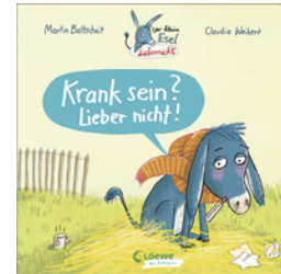
Der kleine Esel Lieber nicht - Krank sein? Lieber nicht!