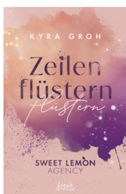
Zeilenflüstern (Sweet Lemon Agency, Band 1)