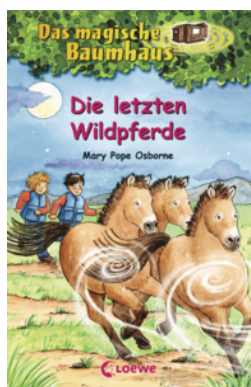
Das magische Baumhaus (Band 63) - Die letzten Wildpferde