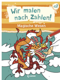
Wir malen nach Zahlen! - Magische Wesen