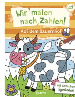
Wir malen nach Zahlen! - Auf dem Bauernhof