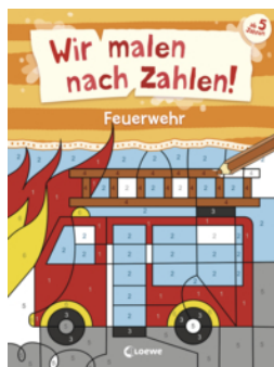
Wir malen nach Zahlen! - Feuerwehr