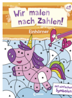
Wir malen nach Zahlen! - Einhörner