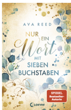
Nur ein Wort mit sieben Buchstaben