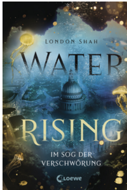
Water Rising (Band 2) - Im Sog der Verschwörung