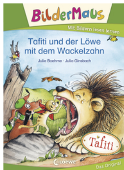
Bildermaus - Tafiti und der Löwe mit dem Wackelzahn