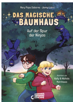
Das magische Baumhaus (Comic-Buchreihe, Band 5) - Auf der Spur der Ninjas