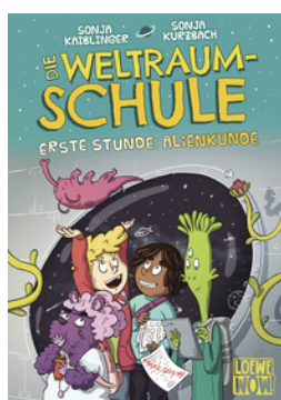
Die Weltraumschule (Band 1) - Erste Stunde: Alienkunde