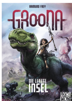
Groona - Die letzte Insel