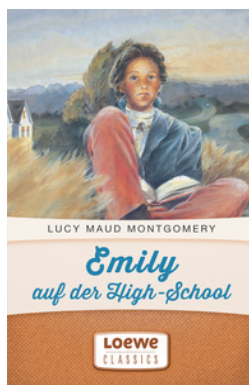
Emily auf der High-School