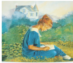
Emily auf der Moon-Farm