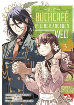
Mein Buchcafé in einer anderen Welt 03