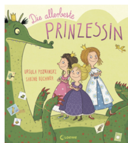
Die allerbeste Prinzessin