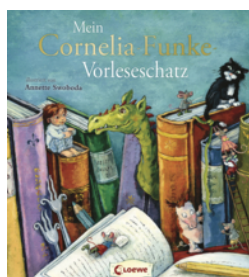
Mein Cornelia-Funke- Vorleseschatz