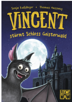
Vincent stürmt Schloss Geisterwald (Band 4)