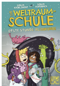
Die Weltraumschule (Band 1) - Erste Stunde: Alienkunde