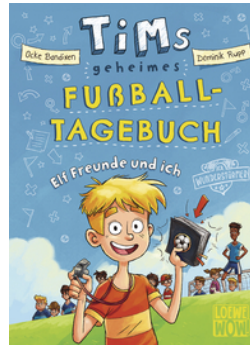
Tims geheimes Fußball- Tagebuch (Band 1) - Elf Freunde und ich!