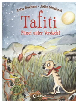
Tafiti (Band 22) - Pinsel unter Verdacht