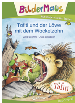
Bildermaus - Tafiti und der Löwe mit dem Wackelzahn