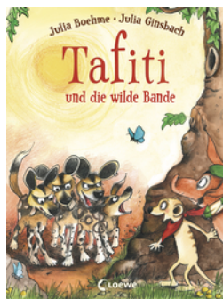
Tafiti und die wilde Bande (Band 20)