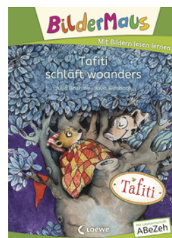
Bildermaus - Tafiti schläft woanders