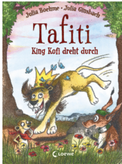
Tafiti - King Kofi dreht durch (Band 21)