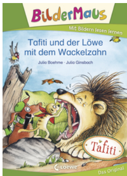
Bildermaus - Tafiti und der Löwe mit dem Wackelzahn