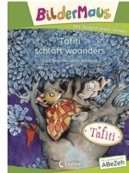
Bildermaus - Tafiti schläft woanders