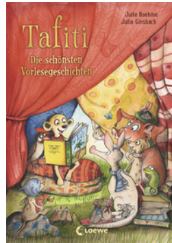
Tafiti - Die schönsten Vorlesegeschichten