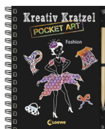
Kreativ-Kratzel Pocket Art: Fashion