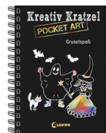
Kreativ-Kratzel Pocket Art: Gruselspaß