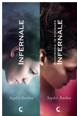
Infernale - Doppelbundle