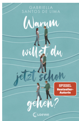
Warum willst du jetzt schon gehen?