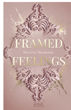
Framed Feelings (Golden Hearts, Band 1)