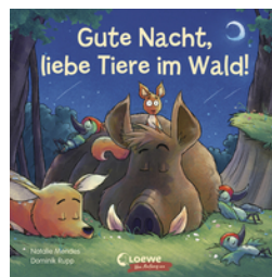
Gute Nacht, liebe Tiere im Wald!