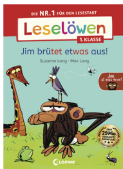
Leselöwen 1. Klasse - Jim ist mies drauf - Jim brütet etwas aus!