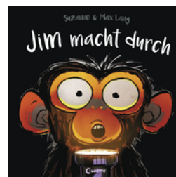
Jim macht durch