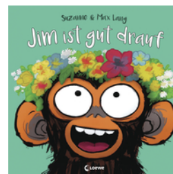
Jim ist gut drauf