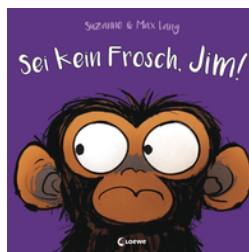
Sei kein Frosch, Jim!