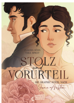
Stolz und Vorurteil