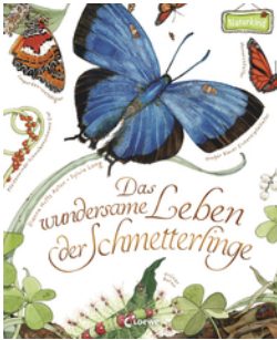
Das wundersame Leben der Schmetterlinge