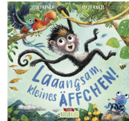
Laaangsam, kleines Äffchen!