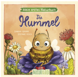
Mein erstes Naturbuch - Die Hummel