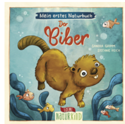
Mein erstes Naturbuch - Der Biber