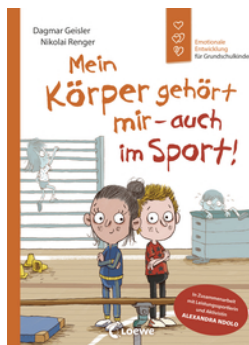
Mein Körper gehört mir - auch im Sport! (Starke Kinder, glückliche Eltern)