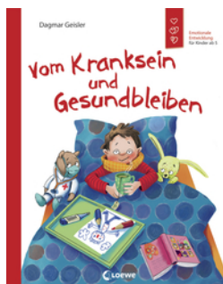
Vom Kranksein und Gesundbleiben (Starke Kinder, glückliche Eltern)