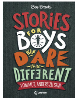
Stories for Boys Who Dare to be Different - Vom Mut, anders zu sein