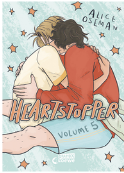
Heartstopper Volume 5 (deutsche Hardcover-Ausgabe)