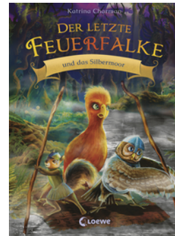
Der letzte Feuerfalke und das Silbermoor (Band 8)