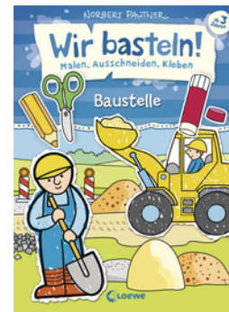
Wir basteln! - Malen, Ausschneiden, Kleben - Baustelle