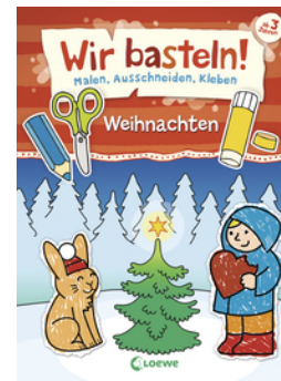
Wir basteln! - Malen, Ausschneiden, Kleben - Weihnachten