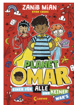
Planet Omar (Band 4) - Einer für alle und keiner war's