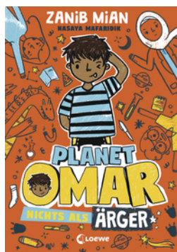
Planet Omar (Band 1) - Nichts als Ärger