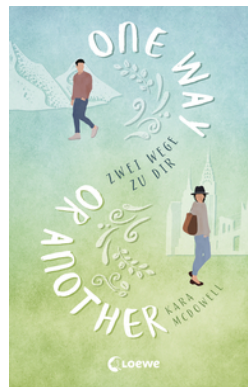
One Way Or Another