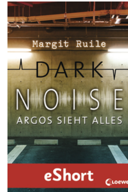
Dark Noise - Argos sieht alles