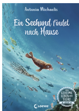
Das geheime Leben der Tiere (Ozean) - Ein Seehund findet nach Hause