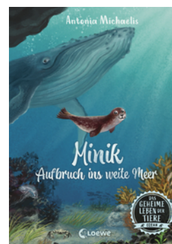
Das geheime Leben der Tiere (Ozean) - Minik - Aufbruch ins weite Meer